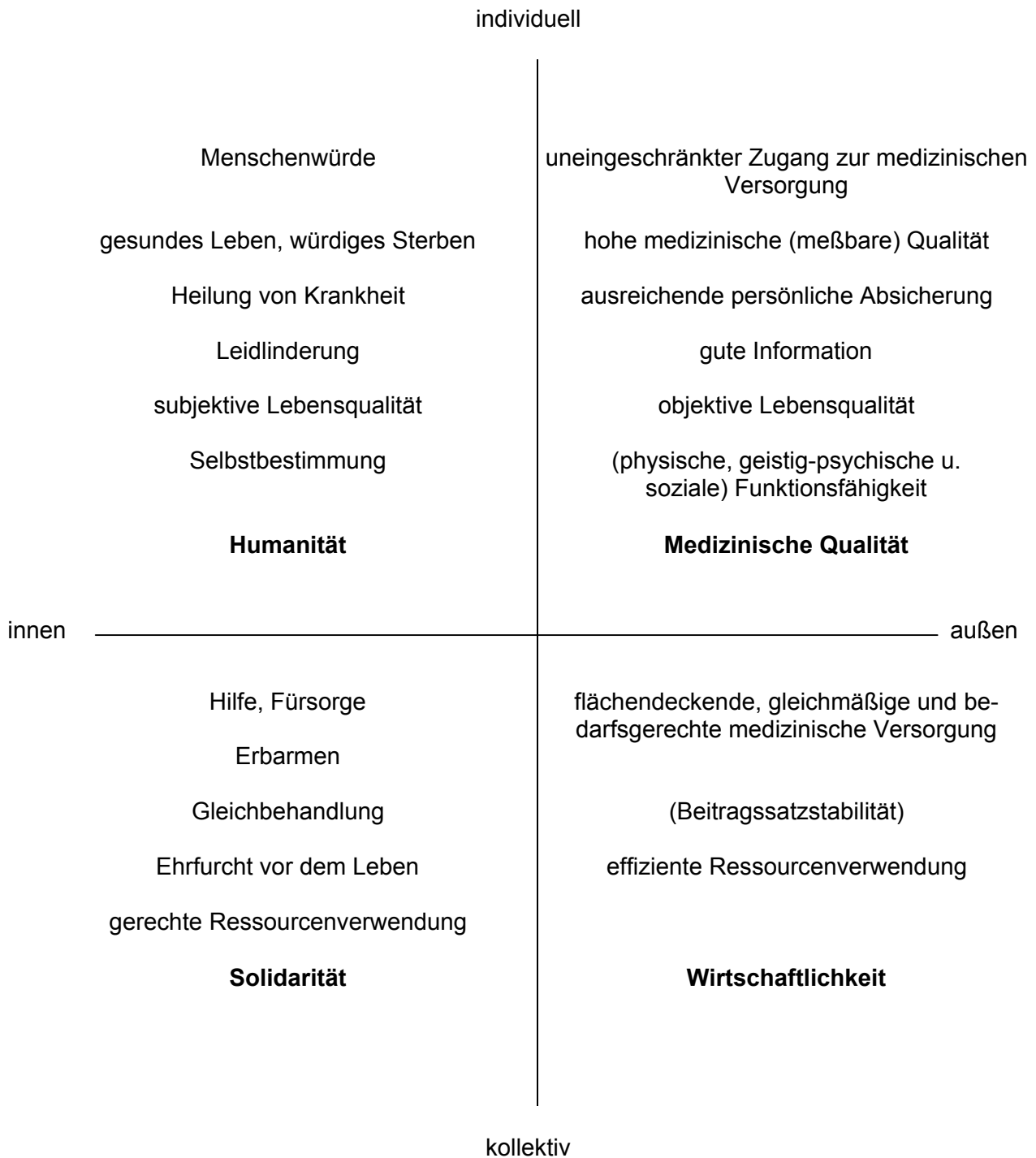
Abbildung 3 GRUNDWERTE IM GESUNDHEITSWESEN